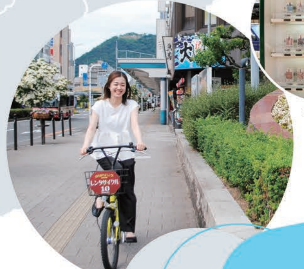
#カバンストリート