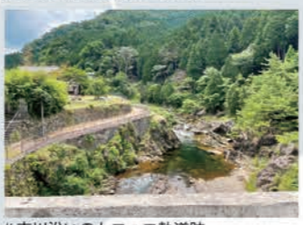
#市川沿いのトロッコ軌道跡