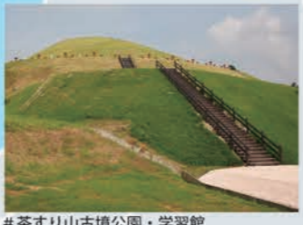
#茶すり山古墳公園・学習館